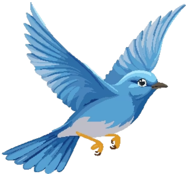
자유롭게 날고 있는 새